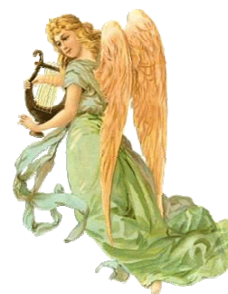
ROSA MYSTICA NA CATEDRAL DE MONTECHIARI - ITÁLIA

Ao pegar a primeira ROSA na Sagração/Benção do Óleo do Arcanjo Rafael você está sendo convidado(a) a participar da Missão que Deus Pai confiou à Virgem Maria sob o título de ROSA MYSTICA , atendendo ao que pede a cor da Rosa.